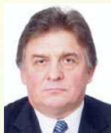
Саливон Владимир Олегович Журналист, вице-президент Федерации спортивных журналистов России, лауреат премии «Золотое перо России»