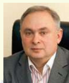
Жестяников Леонид Владимирович Член Исполкома Паралимпийского комитета России