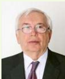
Лукин Владимир Петрович Президент Паралимпийского комитета России, профессор, доктор исторических наук