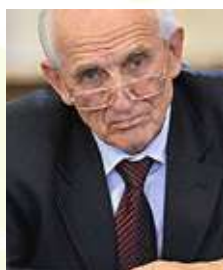
Царик Анатолий Владимирович Вице-президент Паралимпийского комитета России