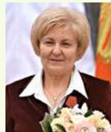
Абрамова Лидия Павловна Вице-президент Паралимпийского комитета России, Президент Федерации спорта слепых